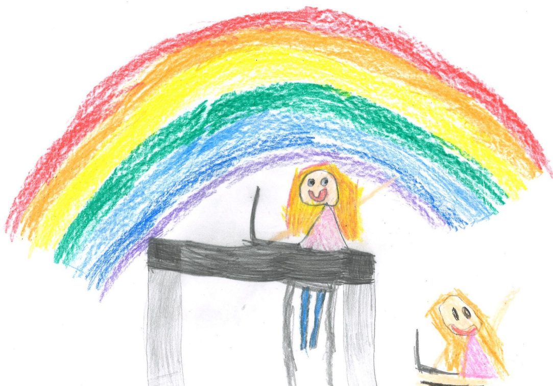
Tegnet av Tiril i 1a